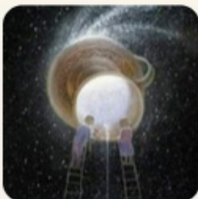
Художник Олег Шупляк