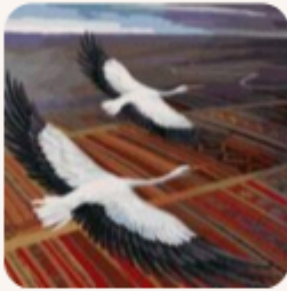
Художник Олег Шупляк