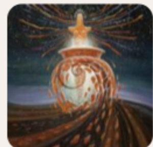
Художник Олег Шупляк

Сфокусуватись на тому, що єднає, та прийняти відмінності інших