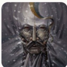
Художник Олег Шупляк

Відновлення впевненості в собі, формування внутрішньої опори